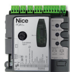
POA1 náhradná riad. jednotka pre PP7024 1 ks/bal.