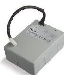
PS124 24 V batéria so zabudovaným dobíjaním 1 ks/bal.