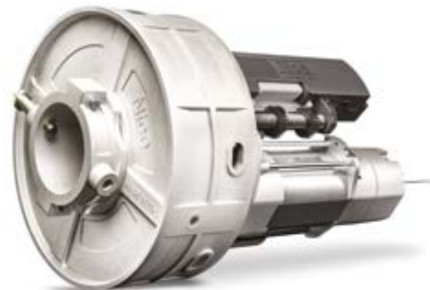
Modely s dvojitým motorom RN2080 a RN2480