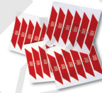
WA10 červené odrazové samolepky 24 ks/bal.