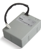
PS124 24 V batéria so zabudovaným dobíjaním 1 ks/bal.